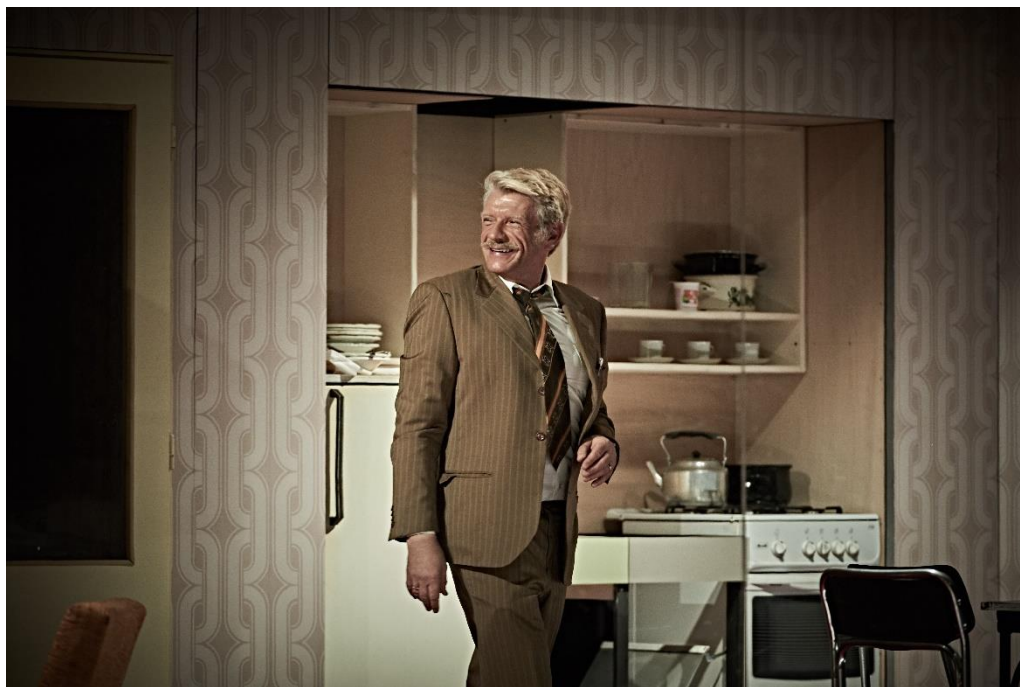
Obrázok 2 Jiří Havelka a kolektív: Elity. Minulosť je pred nami . Činohra SND, 2017. Richard Stanke.

bezpečnostnej služby tu vystupujú aj „obete“, menej či viac ochotní spolupracovníci. Diváci doma i v Čechách spontánne prijímajú túto bratislavskú inscenáciu, ktorá je konkrétnymi postavami umiestnená na Slovensko. Dokážu sa orientovať v postavách známych ľudí, ale oceňujú najmä obraz súčasnosti, v ktorom sú oligarchovia pevne zakotvení a z ktorého niet východiska.