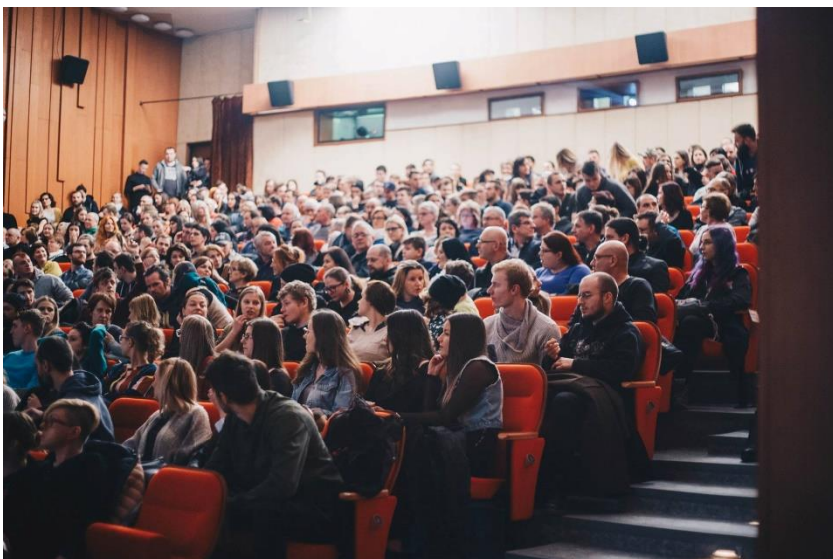
Fotografia 4: Premiéra Krásna