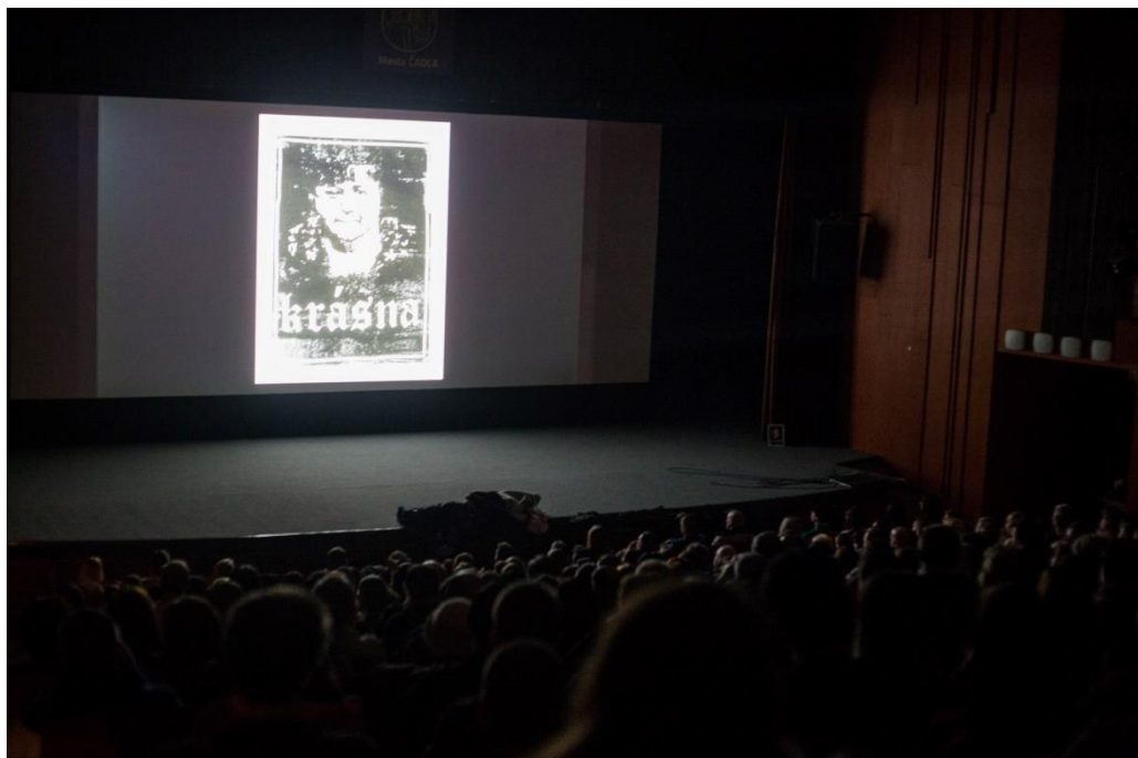
Fotografia 3: Premiéra Krásna

Ľudí na akademickej pôde si hocičím nezískaš. Dôkladnejšie analyzujú to, s čím prichádzaš. Dá sa povedať, že keď premietaš film laikom, tak sú ti chyby ľahšie odpustené. Zvlášť ľudia v Čadci sú radi za to, že niekto niečo tvorí. Som rád za každú možnosť prezentovania a pred každým publikom.