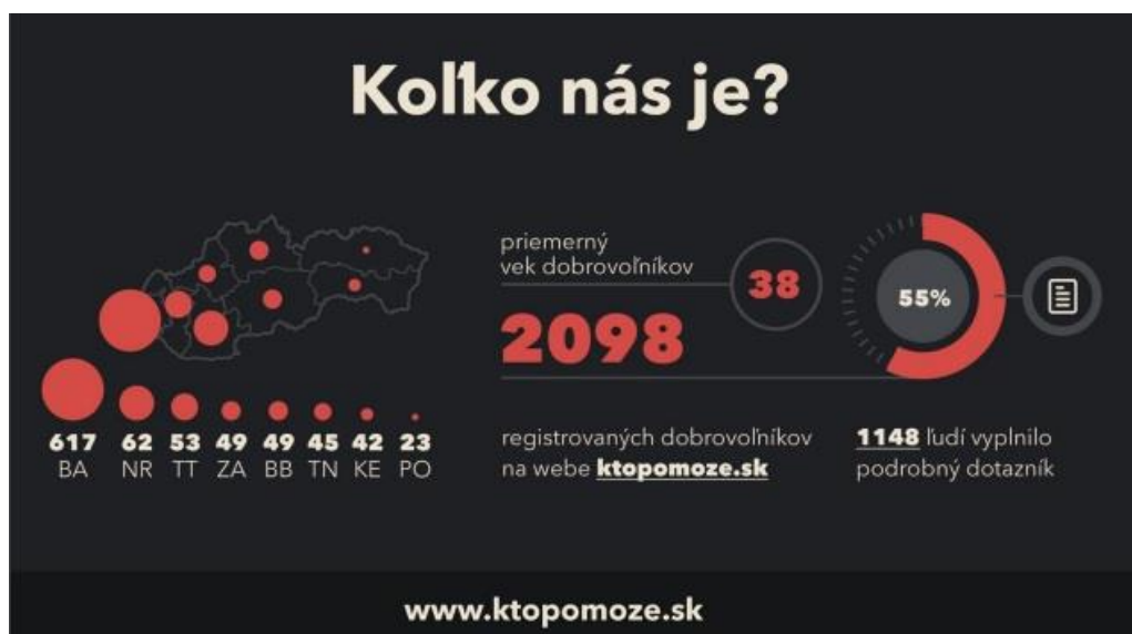
Obrázok 3 Regionálne zastúpenie registrovaných dobrovoľníkov/-čok

dobrovoľníkov bol 38 rokov a čo sa týka regionálneho zastúpenia registrovaných záujemcov, najviac ich bolo z Bratislavského kraja (617), na druhom mieste bol Nitriansky kraj (62), Trnavský, Žilinský, Banskobystrický, Trenčiansky a Košický kraj mali priemerne 50 záujemcov a najmenej ich bolo z Prešovského kraja (23) (Obrázok 3). Z registrovaného počtu bolo najviac záujemcov ochotných učiť slovenčinu, resp. viesť konverzačné kurzy v slovenčine – bolo ich 943 (z toho 68 vyštudovaných učiteľov/-iek) a čo je zaujímavé, tak 17 registrovaných dobrovoľníkov zároveň deklarovalo ovládanie arabského jazyka. 32