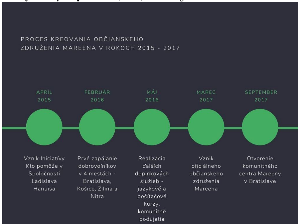
Obrázok 2 Časová os: od Iniciatívy Kto pomôže? po občianske združenie Mareena Vlastné spracovanie. Zdroj: Mareena. Výročná správa 2017 . [cit. 2021-11-15] Dostupné na: https://mareena.sk/assets/files/VS_Mareena_2017.pdf

3. marca 2017 sa Iniciatíva Kto pomôže? zmenila na registrované občianske združenie s názvom Mareena s cieľom realizovať aktivity aj naďalej a asistovať tak utečencom a cudzincom v rámci integračného procesu na území Slovenska. Od roku 2017 Mareena funguje primárne v 3 slovenských mestách: v Bratislave, Košiciach a Nitre.