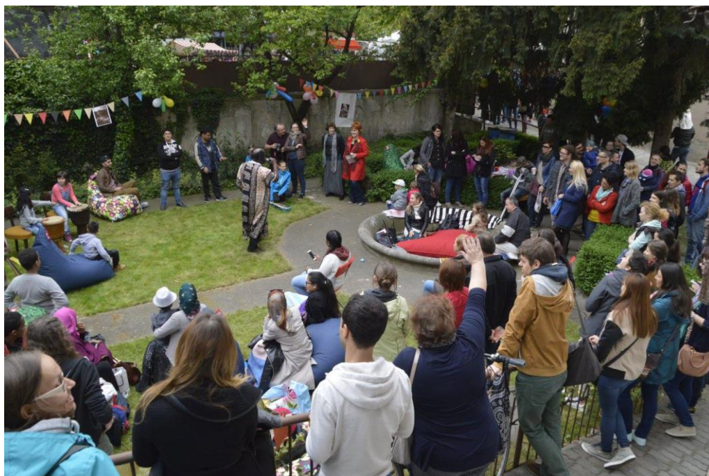
Obrázok 2 Jedno z prvých komunitných podujatí Iniciatívy Kto pomôže? - 29. apríl 2019 Bratislava

Iniciatíva v spolupráci s ďalšími organizáciami začala približne od mája 2016 realizovať aj prvé vzdelávacie aktivity - počítačový a jazykový kurz pre ľudí s udelenou medzinárodnou ochranou a v spolupráci najmä so Slovenskou katolíckou charitou v Bratislave aj prvé komunitné aktivity, ktoré mali slúžiť ako priestor pre oddych a vzájomné spoznávanie sa medzi Slovákami a utečencami.