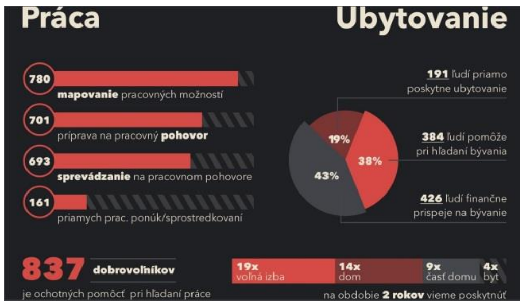
Obrázok 4 Registrovaní dobrovoľníci ponúkajúci pomoc s prácou a ubytovaním

pomoc s hľadáním ubytovania a 191 zaregistrovaných záujemcov ponúklo ubytovanie (Obrázok 4). 33