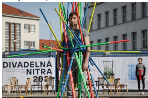
Obrázok 3 Marie Gourdain a kolektív: Icarus . Asociácia Divadelná Nitra, Tanec Praha, tYhle - Be SpectActive!, 2021.

záštitou BeSpectActive! Celková performancia veľmi dobre hrala s prostredím námestia a zaujala divákov všetkých vekových kategórií. Miesto konania umožňovalo vidieť túto výnimočnú performanciu z rôznych uhlov pohľadu.