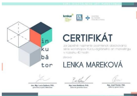
Obrázok 4 Certifikáty boli udelené celkovo siedmim pracovníkom kultúrnych inštitúcií