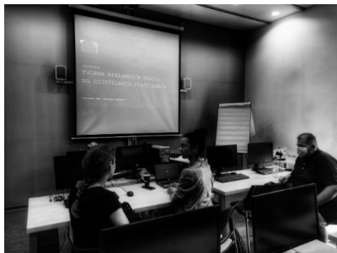
Obrázok 3 Momentka z priebehu workshopu o tvorbe reklamných textov na digitálnych platformách

napríklad zamestnankyne Krajskej knižnice Karola Kmeťka v Nitre, mestského kultúrneho centra v Hlohovci, Piešťanoch, Bánovciach nad Bebravou, ako aj nitrianskeho Hídeparku, neziskovej organizácie Post Bellum. Ženský kolektív doplnil pracovník Západoslovenského múzea v Trnave.