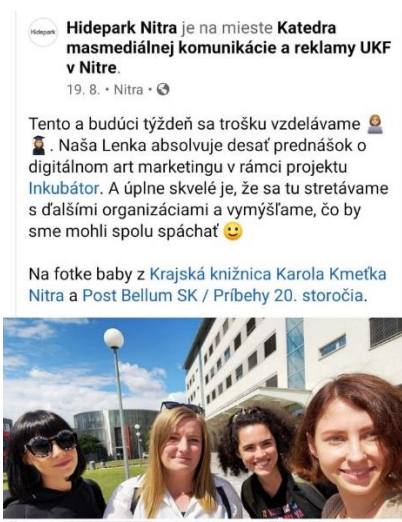
Obrázok 5 Príspevok na FB stránke Hideparku, ktorý odkazuje na coworking ako pridanú hodnotu účasti na vzdelávaní

Okrem zvyšovania digitálnych art marketingových kompetencií priniesol kurz priestor pre coworking , teda nadväzovanie spoluprác medzi jednotlivými kultúrnymi inštitúciami , čo dokazuje príspevok na FB stránke Hideparku (viď Obrázok 5), v ktorom sa na adresu kurzu píše, citujeme: “A úplne skvelé je, že sa tu stretávame s ďalšími organizáciami a vymýšľame, čo by sme mohli spolu spáchať” . Tento fakt považujeme za bonus, ktorý predčil naše očakávania.