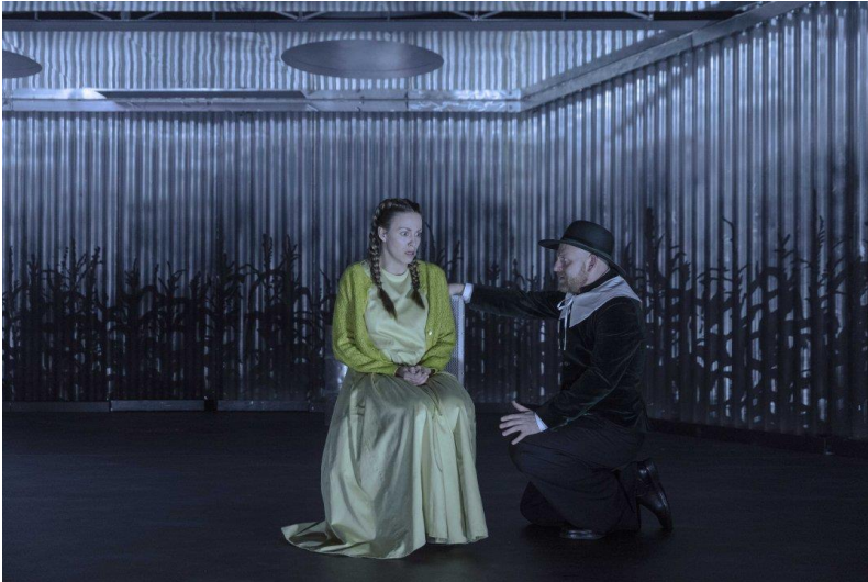
Obrázok 1 Scéna z inscenácie: Salemské bosorky