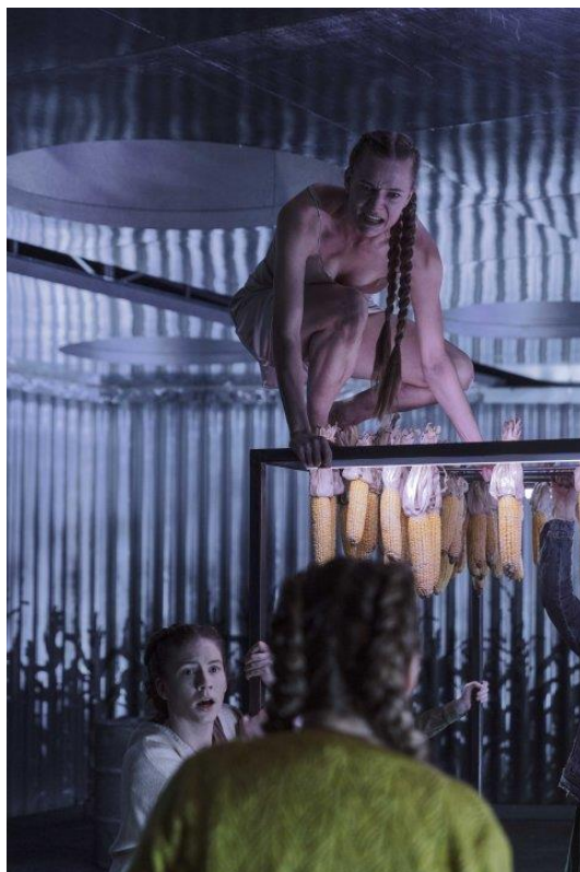
Obrázok 5 Scéna z inscenácie: Salemské bosorky