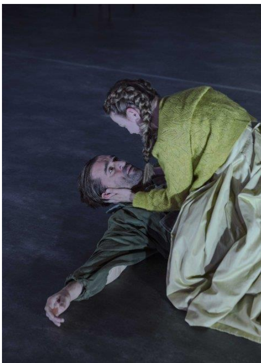
Obrázok 3 Scéna z inscenácie: Salemské bosorky