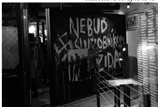
Časť expozície Múzea holokaustu v Seredi.