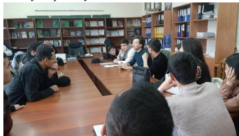
Beseda so študentmi a študentkami Katedry filozofie a logiky Fakulty sociálnych vied (National University of Uzbekistan named after Mirzo Ulugbek) v Taškente.