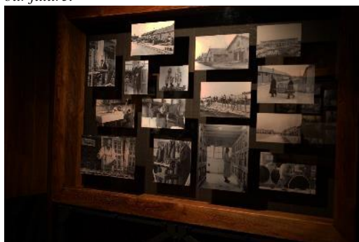
Časť expozície Múzea holokaustu v Seredi. Dobové propagačné fotografie pracovného tábora.

V dňoch 21.11.-23.11.2022 sa konala multi-žánrová medzinárodná vzdelávacia konferencia Slobodní študenti #FOREVER pre študentov a študentky univerzít, pedagógov a pedagogičky, čerstvých absolventov a absolventky. Z našej univerzity sa zúčastnilo sedem študentov z Oddelenia kulturológie pri ÚMKTKE, a jedna študentka z Katedry masmediálnej komunikácie a reklamy. Konferencia bola organizovaná občianskym združením Post Bellum a mnohými ďalšími partnermi a stala sa otváracím podujatím projektu History defines our future .