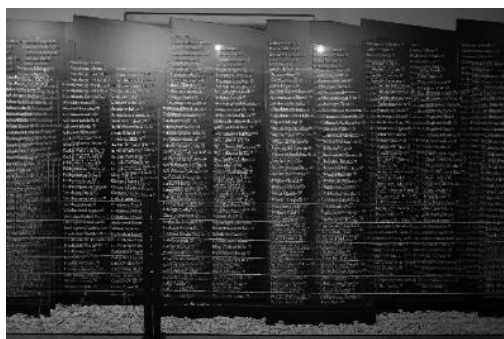
Časť expozície Múzea holokaustu v Seredi. Zoznamy s menami zadržovaných židov.