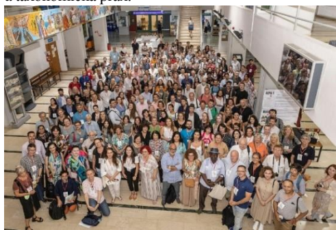
Účastníci 15. Svetového kongresu semiotiky 2022.

Samotný 15th World Congress of Semiotics so zastrešujúcou témou Lifeworld sa uskutočnil v priestoroch Macedónskej univerzity v dňoch 30. augusta až 3. septembra 2022. Vystúpilo na ňom viac ako 600 (!) prednášajúcich zo všetkých kontinentov sveta, pričom rokovanie prebiehalo paralelne v cca pätnástich rôznych, meniacich sa sekciách a každý deň uzatvárali minimálne tri až štyri prednášky hlavných rečníkov. Diapazón jednotlivých sekcií siahal od kontextov hlavnej témy, semiotiky rôznych druhov umenia a kultúry, materiálnej kultúry, politiky cez filozofiu, semiotiku a filozofiu jazyka, vzdelávania, transtextuality, biosemiotiku, existenciálnu semiotiku, históriu, antropológiu až po digitalizáciu, korporálne kontexty atď. V rámci nich spomeniem kvôli predstave o variabilnosti a špecializácii súčasného semiotického výskumu aspoň niektoré tematické okruhy v subsekciiach, akými boli napríklad semiotika spektakulárnosti a intermediality, semiotika marketingu a reklamy, semiotický výskum migračných naratívov, environmentalistiky a každodenného života, alebo znaky života a smrti vo verejnej sfére v čase pandémie, či epistemologický status semiotiky a taxonomická prax.