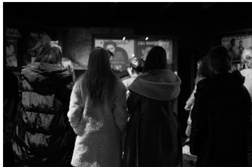
Študenti počas komentovanej prehliadky Múzea holokaustu v Seredi.

komentovanej prehliadky Múzea holokaustu v Seredi, tá bola realizovaná v dvoch podobách, a to v slovenskom a anglickom jazyku pre zahraničných hostí. Po prehliadke nasledovalo premietanie dokumentárneho filmu Identita ES .