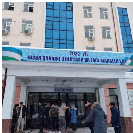
Fakulta sociálny vied, National University of Uzbekistan named after Mirzo Ulugbek (Tashkent).