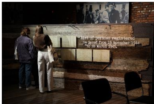
Časť expozície, Múzea holokaustu v Seredi.

Miesto konania tejto konferencie, teda dnešné Múzeum holokaustu v Seredi, bolo počas 2. svetovej vojny miestom pracovného a koncentračného tábora. Na tomto mieste boli väznení a nútení ťažko pracovať všetci. Aj deti a mladí ľudia v školskom veku, ktorí tak stratili akúkoľvek slobodu. V dnešnom svete si to, ako mladá generácia, ktorá o krutej minulosti iba počúva, nevieme ani len predstaviť. Práve preto, aby sa história nemusela opakovať a dokázali sme sa ako spoločnosť z nej poučiť, vznikajú pamätníky ako je Múzeum holokaustu v Seredi. Názov konferencie priamo súvisí s odkazom tohto pietneho miesta aj s nosnou témou tohto podujatia. Konferencia bola otvorená komentovanou prehliadkou jednotlivých barakov sústreďujúcich rôzne pamätníky a expozície smutných dôkazov nacistického režimu.