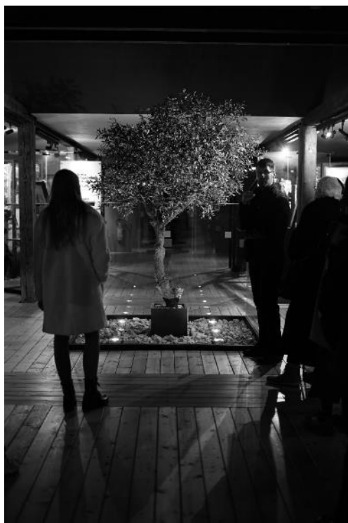
Olivovník, symbol Spravodlivý medzi národmi.