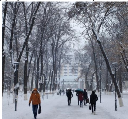
Univerzitný kampus v Taškente ako mesto v meste.

z rozsiahlych parkov na okraji Taškentu ako doslova mesta v meste s tisícami študentov v množstve rozptýlených budov fakúlt a ďalších pracovísk.