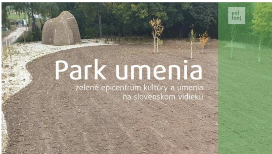
Park Umenia v Bátovciach.